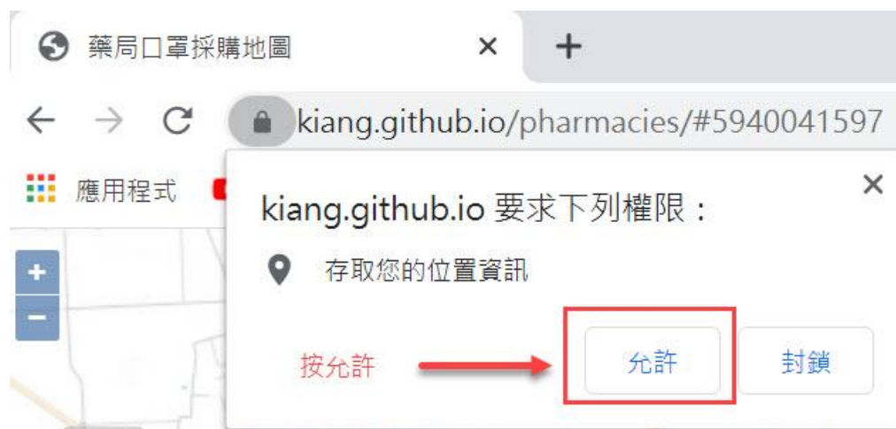
圖 03. 藥局口罩採購地圖網站定位存取要求

第一次進入此網頁，會出現小視窗要求存取您的位置資訊，記得按允許後，進入會出現民雄市區所在區域附近的藥局清冊。