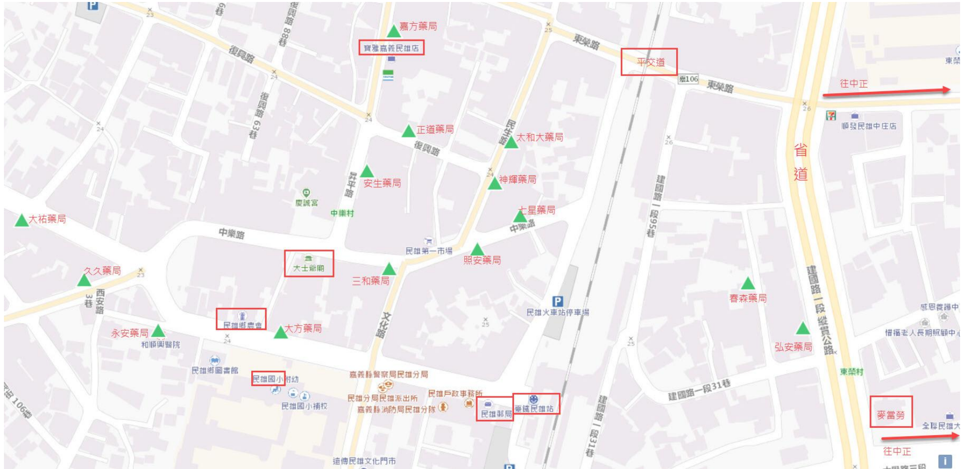
圖 05. 簡列民雄市區內藥局分布